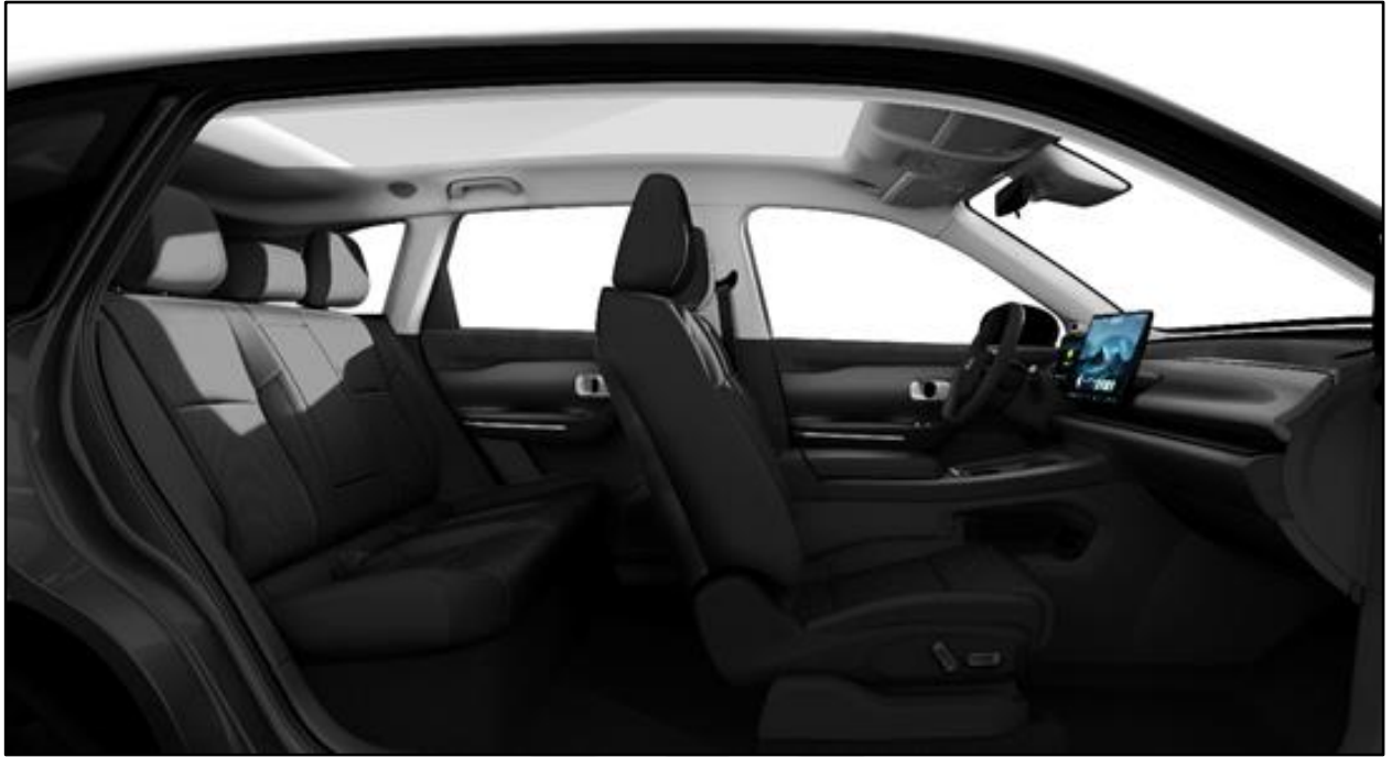
Black (OEKOTEX®-zertifizierte Silikonledersitze)