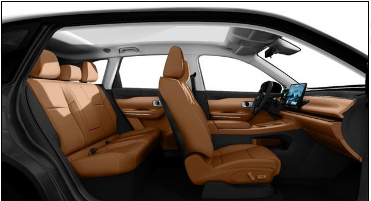
Camel Brown (OEKOTEX®-zertifizierte Silikonledersitze)